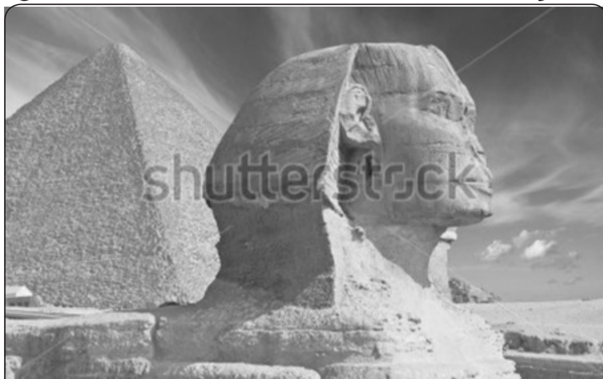
Kumbukumbu ya sanamu linaloonesha moja ya picha za Mafarao waliowahi kutawala Misri enzi za Nabii Mussa a.s.

Rai inayoshikwa na wengi katika muujiza huu ni kwamba fimbo iligeuka na kuwa nyoka, na kwamba alipoishika mara ya pili fimbo ilirudi katika