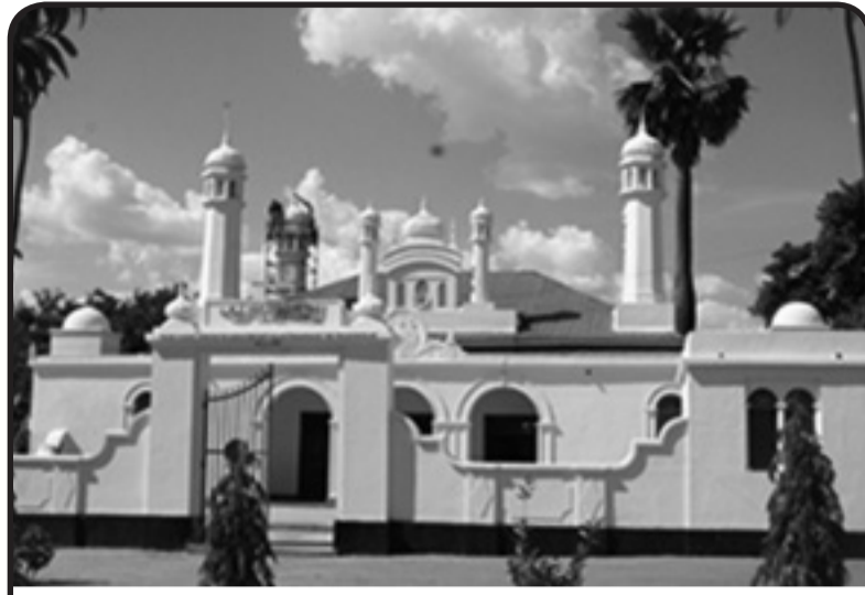
Masji Fazal Tabora - Msikiti wa kwanza wa Jumuiya ya Waislamu Waahmadiyya Tanzania

Ufunguzi wa Al-fazal ulipambwa na nyota zinazomuelekeza binadamu katika ukombozi na usawa. Watu wa rangi zote, dini zote walikaribishwa na kukaa pamoja bila ya kutumia kigezo cha rangi, dini au kabila. Wote chini ya kivuli hicho wote