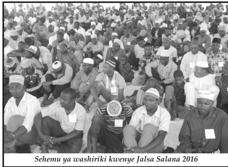
Sehemu ya washiriki kwenye Jalsa Salana 2016

Kwa mara ya kwanza katika historia ya Jumuiya hasa katika mikutano ya Jalsa na hii ikiwa ni Jalsa ya 47 mwaka huu tuliweza kuwa na mgeni rasmi Rais Mstaafu wa Awamu ya Pili Alhaji Ally Hassan Mwinyi, ambae amekuwa akialikwa mara kadhaa lakini mwaka huu kwa fadhila za Mwenyezi Mungu aliweza kufika katika Jalsa. Katika salamu zake, mzee Mwinyi alisisitiza sana juu ya umuhimu wa amani miongoni mwa Jamii za kiislam, na kuwa mifarakano si mizuri kwani inarudisha nyuma maendeleo ya watu. Alipongeza sana jumuiya kwa kufanikisha mkutano huo mkuu wa mwaka na kusema hilo ni jambo zuri kwa Waislam kukutana na kukumbushana mambo mbalimbali ya kidini