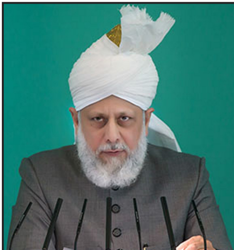
Hadhrat Mirza Masroor Ahmad, Khalifatul Masih V a.t.b.a.

Ndio maana ikaelezwa ya kwamba ili mtu afikie mafanikio ya kweli na imani ni lazima ajitolee mali yake. Imeelezwa ndani ya Kurani "Hamtaufikia wema hasa mpaka mtoe katika vile mnavyovipenda". Ni kwa sababu ukarimu na huruma juu ya viumbe vya Allah ni jukumu lingine kubwa la Muaminio ambalo bila ya hilo Imani haiwezi kuwa kamili na thabiti.